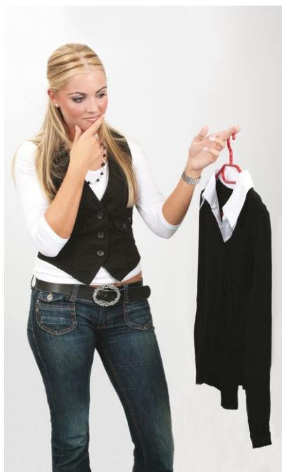
Angemessen gekleidet zum Bewerbungsgespräch – beraten Sie Ihr Kind, wenn es unsicher ist.

Außerdem: Einige Ausbildungen, vor allem aus den Bereichen Gesundheit, Pädagogik und Gestaltung, finden nicht in Betrieben statt, sondern in Berufsfachschulen, Berufskollegs oder Fachakademien. Solche schulische Ausbildungsplätze können in „KURSNET“ gesucht werden, dem Portal für berufliche Aus- und Weiterbildung.