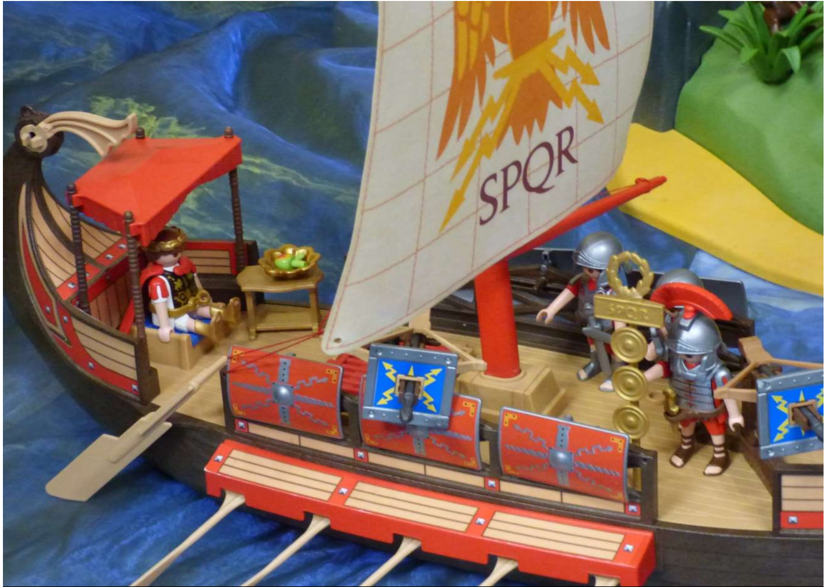
Quondam navis Romana prope litus Asiae erat.